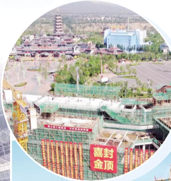
▲综改区无尾钢化真空玻璃产业园项目建设现场。